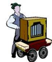
N°11 Pascale/ Jeff