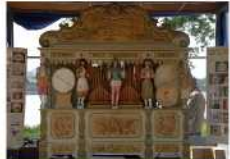
N°1 Sylvie/ Pierre

(En cas de pluie, ces animations seront proposées à la salle de fêtes et au VVF)