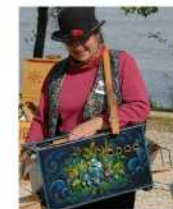
N° 12 Cricri